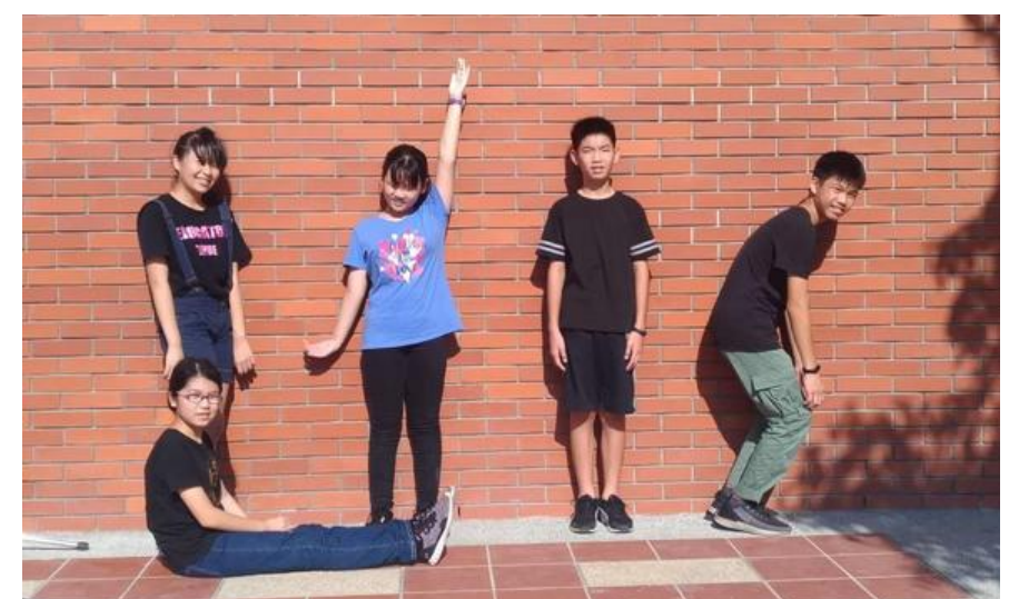
首屆新生闖關畫面