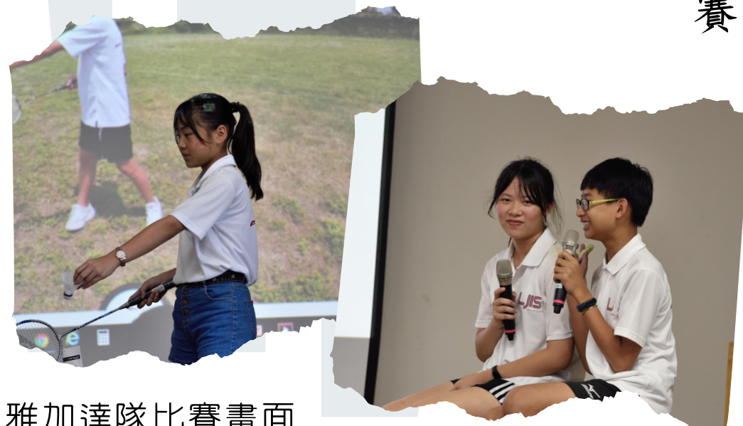
雅加達隊比賽畫面